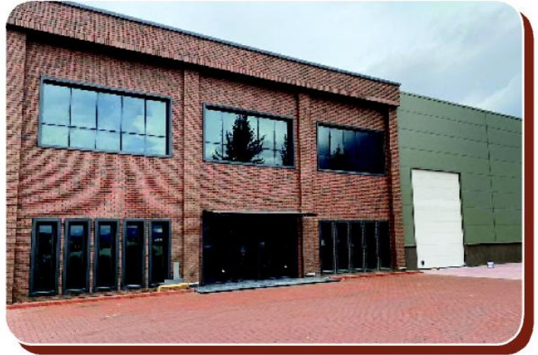
Proje: Armetal Yüzey İşlem Fabrika Binası

Kullanılan ürün: Anadolu Rustik Kaplama Tuğla ve Padova Kiremit