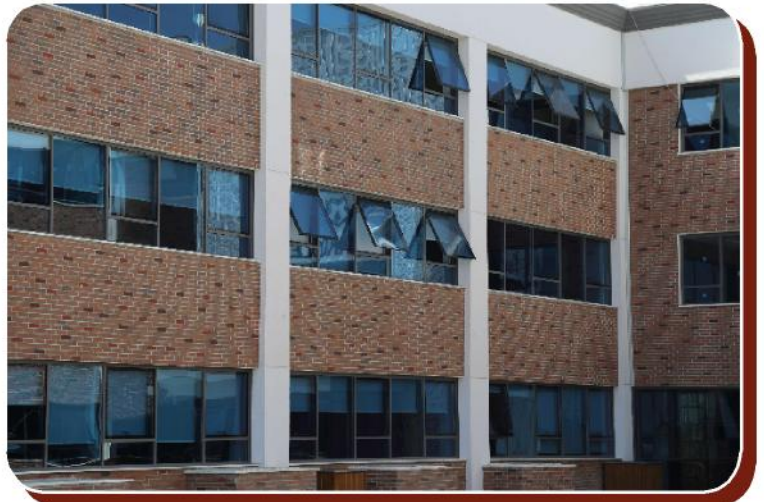
Proje: Çözüm Koleji Şehir: Ankara Kullanılan Ürün: Anadolu Naturel Kaplama Tuğla