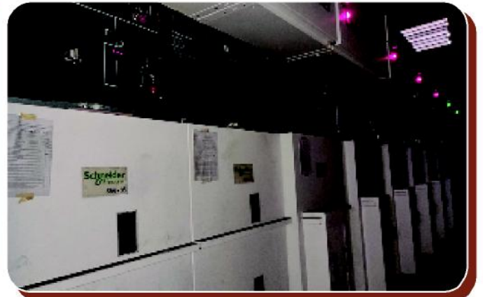
Güneş Enerjisi Şalt Merkezi