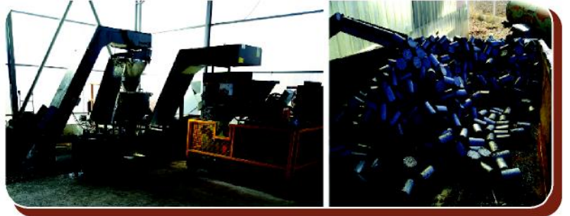
Talaş Presleme Makinası

Yeni yatay hattımızın (HWS SINTO) montajının Haziran ayında başlaması ve Ekim ayında da devreye alınmış olması planlanmaktadır.