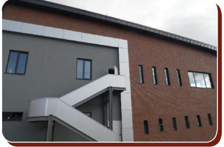
Proje: Tüpraş İdare Binası Şehir: Kırıkkale Kullanılan ürün: Naturel Anadolu Kaplama Tuğla