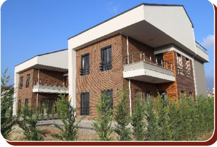
Proje: Eser Mimarlık Villa Projesi