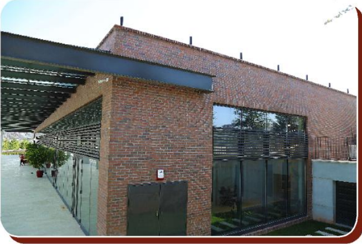
Proje: Mesa Satış Ofisi Şehir: Ankara Kullanılan Ürün: Anadolu Naturel Kaplama Tuğla