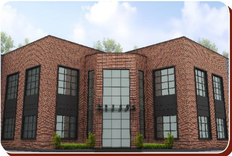
Proje: Messa Makina İdari Bina

Kullanılan ürün: Anadolu Rustik Kaplama Tuğla ve Kırmızı Taban Tuğla